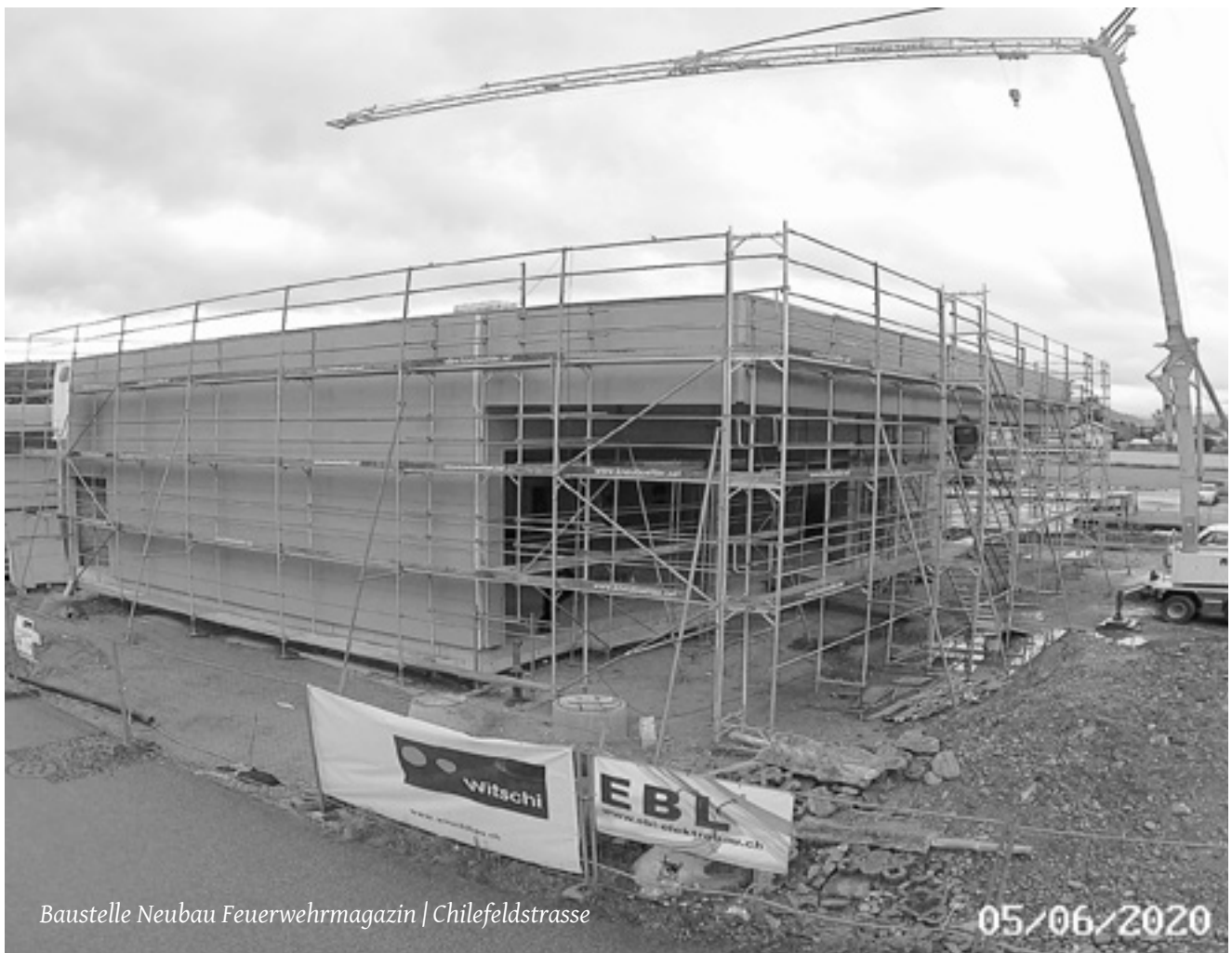
Baustelle Neubau Feuerwehrmagazin | Chilefeldstrasse